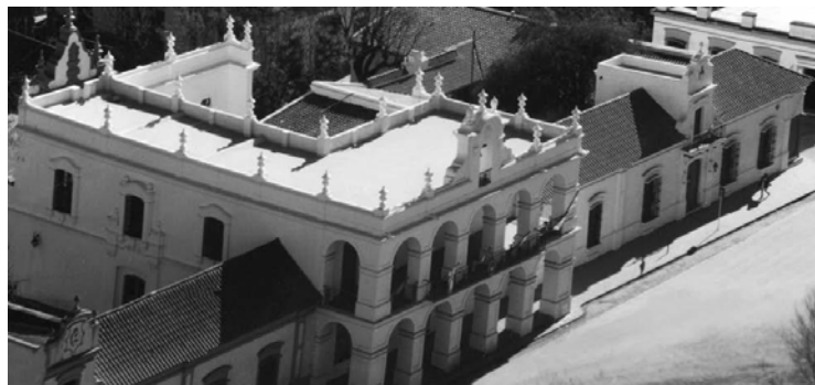
Cabildo de Luján

Y próximamente se iniciarán los trabajos en el Cabildo de Luján, el primero que reconoció a la Junta de Gobierno elegida el 25 de mayo de 1810 . Ese edificio se empezó a construir alrededor de 1770. Las obras estuvieron paralizadas entre 1783 y 1787, mientras duró la suspensión del Cabildo de Luján por litigios con el de Buenos Aires. La Real Ordenanza de Intendencias de 1788 lo restableció en forma definitiva. La construcción del edificio fue reiniciada en 1792 por el maestro de Reales Obras, don Pedro Preciado, quien recomendó rehacer los pilares y levantó planos de ambas plantas para la prosecución de los trabajos, completados en 1797.