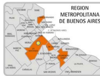
CABILDO DE LUJÁN / Luján