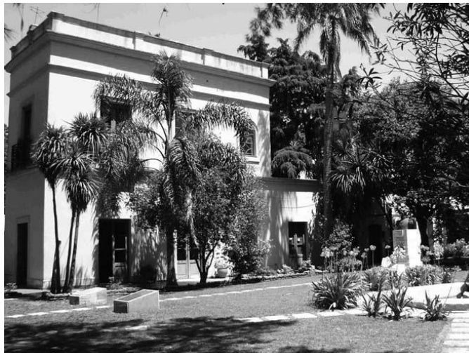
Estancia Virrey del Pino – La Matanza

blanca, 50.000 paraísos, centenares de nogales, olivos y frutales, y una avenida doble de ombúes. En estos campos pastaron los ganados más finos de la provincia, mejorados por "toros tarquino" o Shortorn. El casco, con dos plantas en forma de "U", era originalmente una construcción de cuartos alineados, que debido al crecimiento de la producción agropecuaria se fue ampliando con adiciones sucesivas.